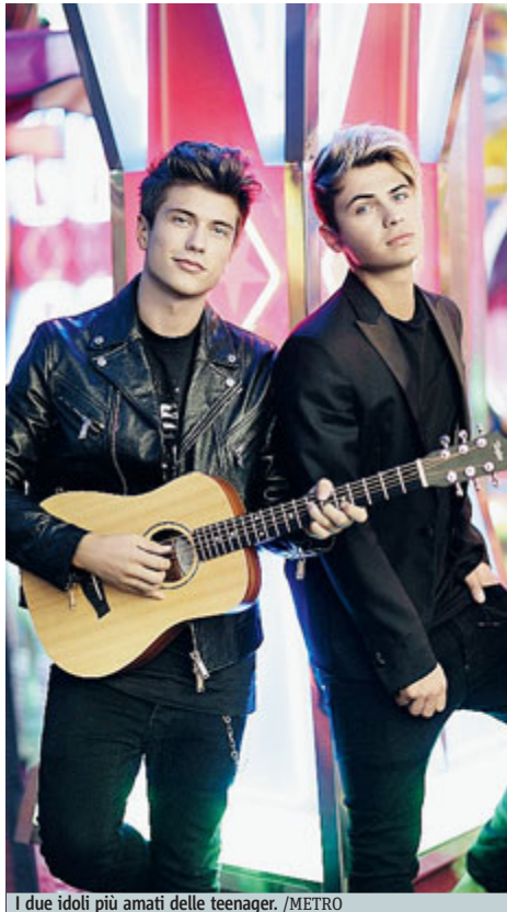
I due idoli più amati delle teenager.